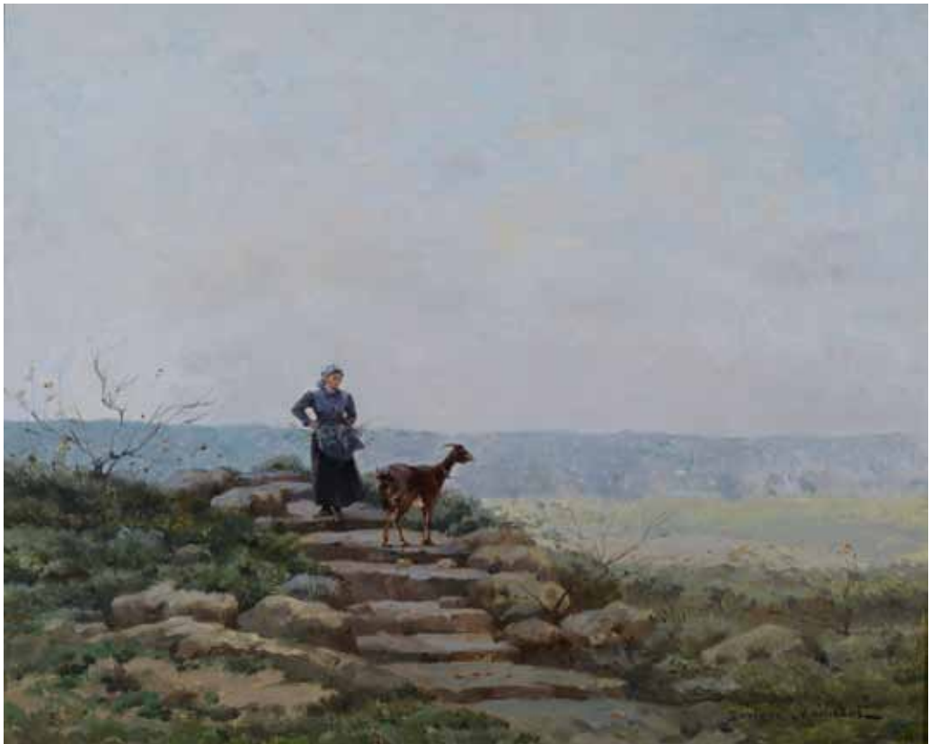
▼ La Chevrière (Titre attribué) Non daté Huile sur toile 37 ; 46 cm Collection P.-F. Maincent