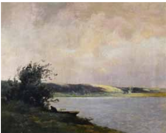
◀ La Barque (Titre attribué ultérieurement) 4 ème quart du XIX e siècle Huile sur toile 46 ; 61 cm Collection P.-F. Maincent