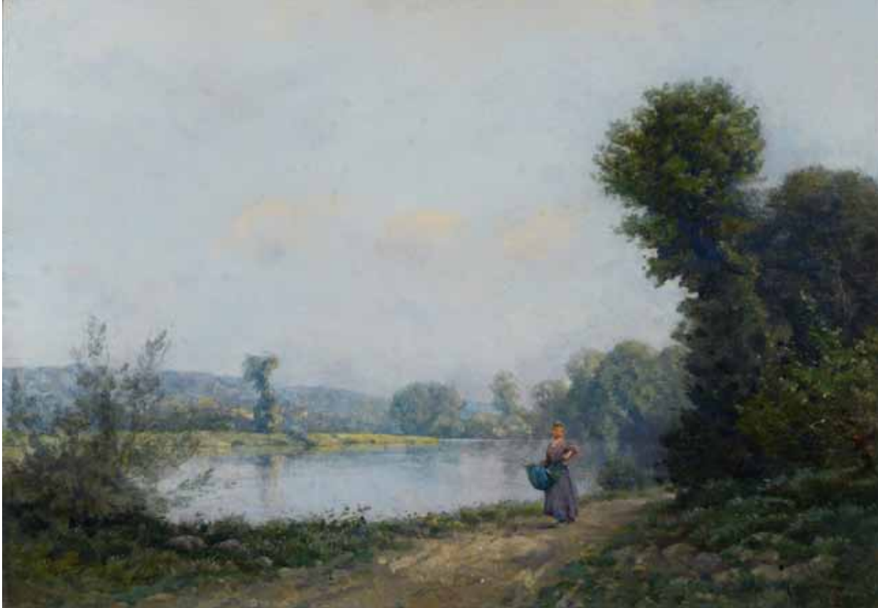
▲ Jeune femme au bord d'une rivière (Titre attribué) Non daté Huile sur toile 81 ; 65 cm Collection particulière