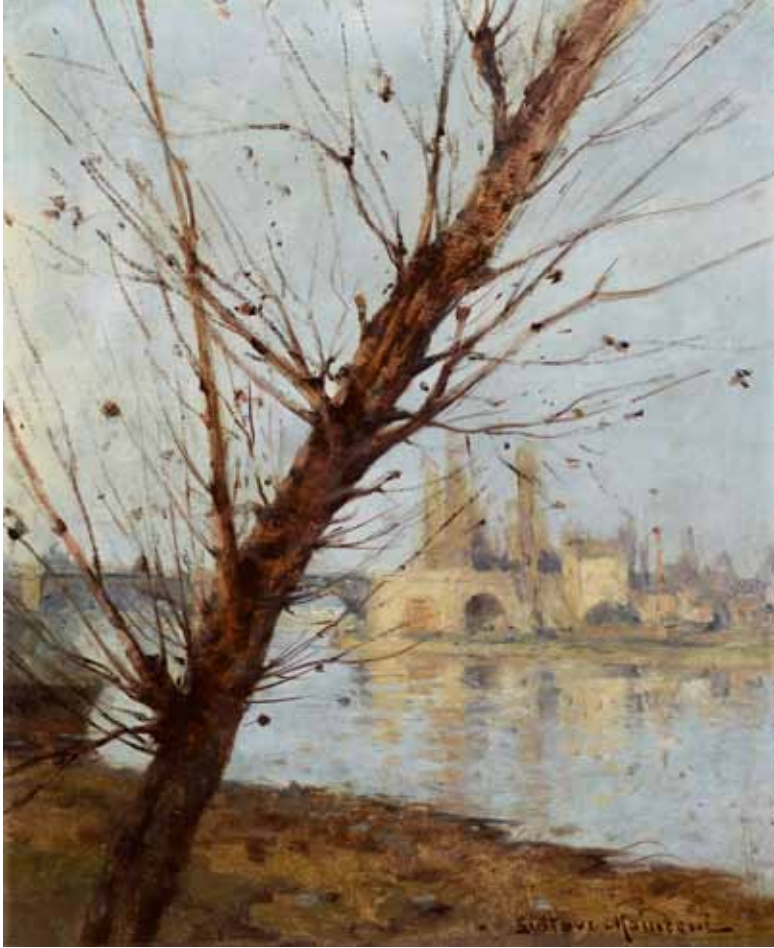
◀ La pile du pont de Chatou sur la rive de Rueil (Titre attribué) Non daté Huile sur toile 46 ; 38 cm Collection particulière