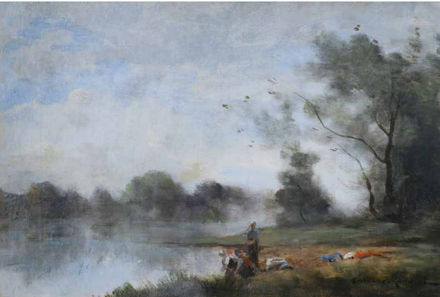
▲ Les Lavandières (Titre attribué) Huile sur toile 27 ; 41 cm Collection particulière