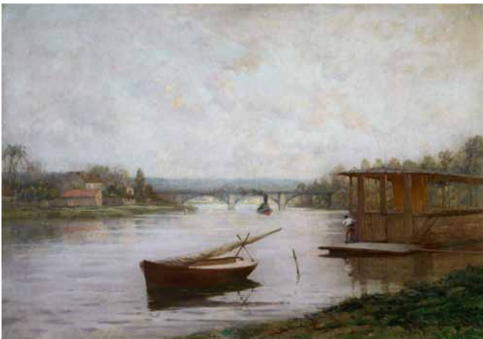
▼ Voilier au mouillage devant le restaurant Fournaise, Chatou (Titre attribué) Non daté Huile sur panneau 77 ; 104 cm Collection particulière