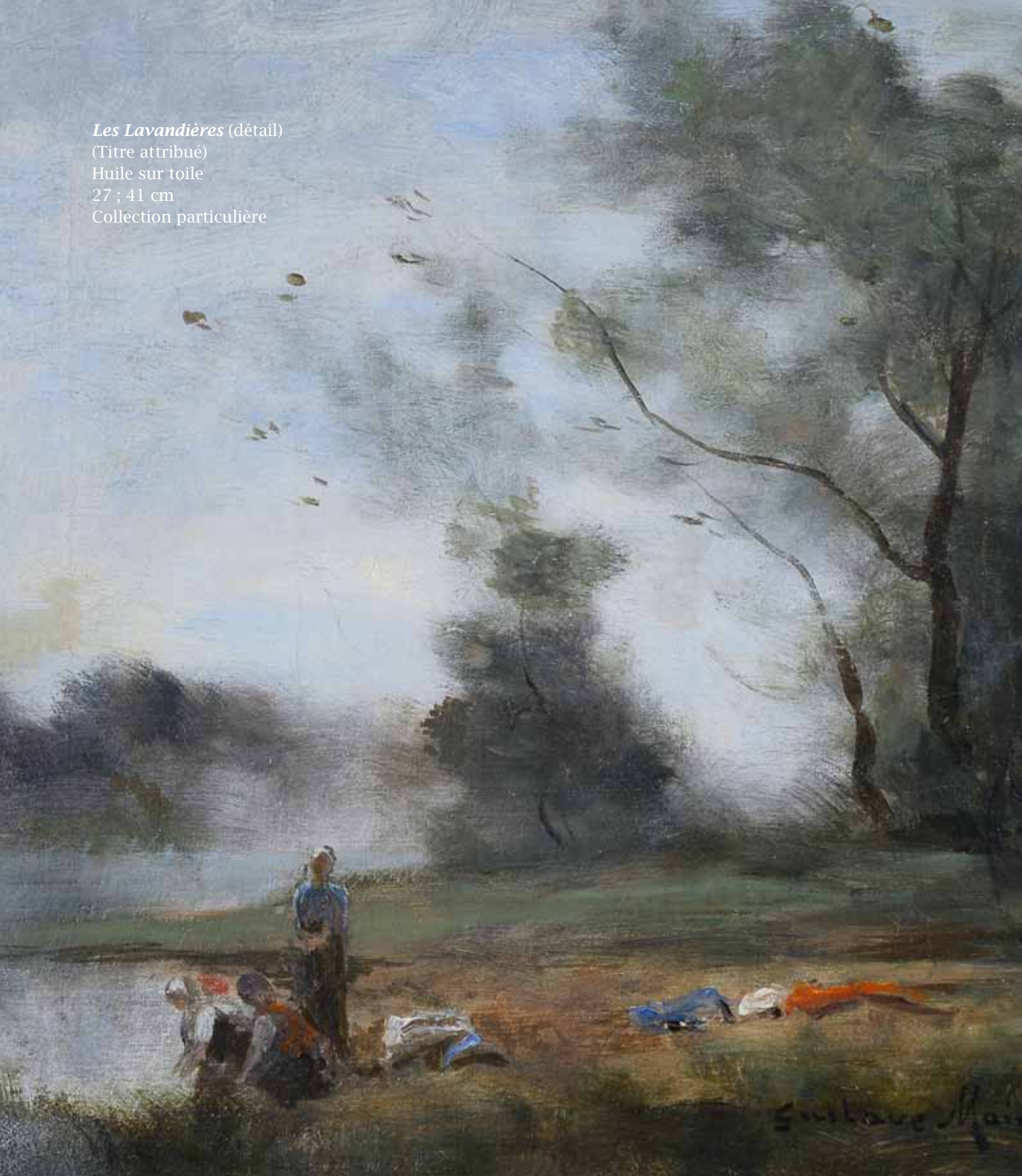
Les Lavandières (détail) (Titre attribué) Huile sur toile 27 ; 41 cm Collection particulière