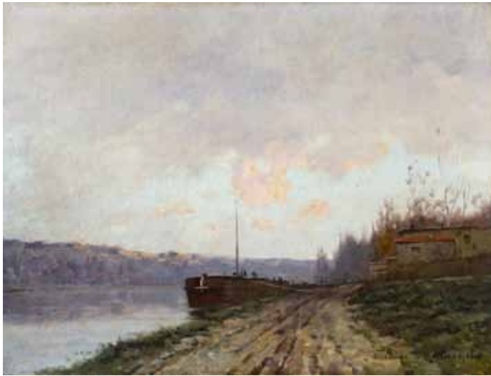
◀ Péniche amarrée en bord de Seine (Titre attribué) Non daté Huile sur toile 45 ; 60 cm Collection particulière