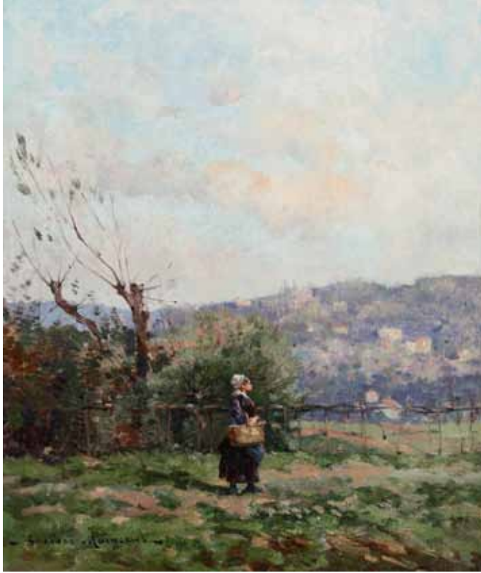
◀ Paysanne au panier (Titre attribué) Non daté Huile sur toile 65 ; 57 cm Collection particulière