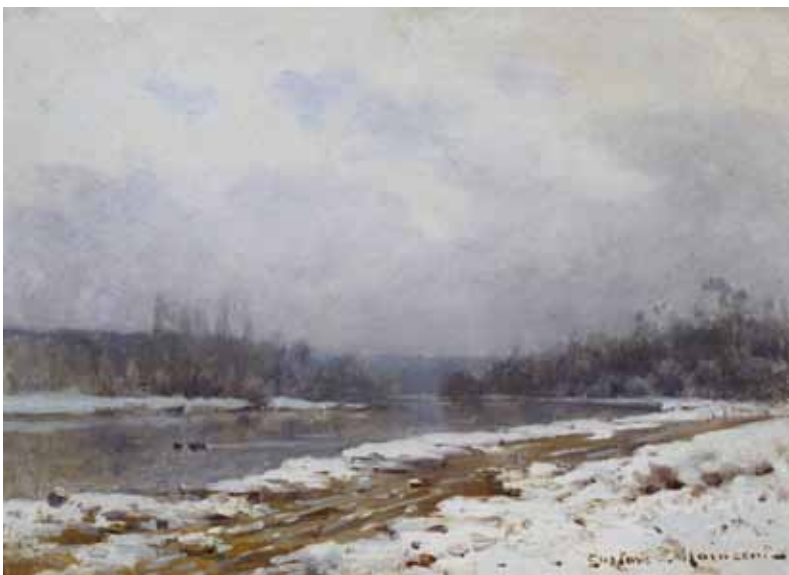
◀ La Seine en hiver (Titre attribué ultérieurement) 4 ème quart du XIX e siècle Huile sur toile 46 ; 33 cm Collection particulière