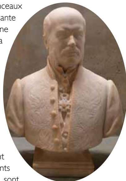
▲ E. Godin Eugène Belgrand (Né le 23 avril 1810 à Ervy-le-Châtel, mort le 8 avril 1878 à Paris) 1886 Marbre 77.5 ; 64 ; 38.5 cm Marne-la-Vallée, Ecole nationale des ponts et chaussées

Pour combattre le mal du siècle, Napoléon III charge le baron Haussmann de faire de Paris une ville enviable et agréable. Le nouveau préfet nomme Eugène Belgrand pour construire le réseau égouts de Paris et l'acheminement de l'eau potable. Dorénavant, c'est à l'extérieur de la capitale que les eaux usées des parisiens sont rejetées dans la Seine. Les conséquences sont désastreuses. Pendant trente ans, les communes riveraines situées en aval, comme Chatou, s'opposent à la ville de Paris. La crainte des épidémies cholériques reste la préoccupation constante des autorités en charge de l'hygiène et de la santé publique. En 1892, 2000 personnes meurent encore dans le département de la Seine, et à Chatou, le choléra fait une victime, Victor Levanneur qui résidait sur l'île.