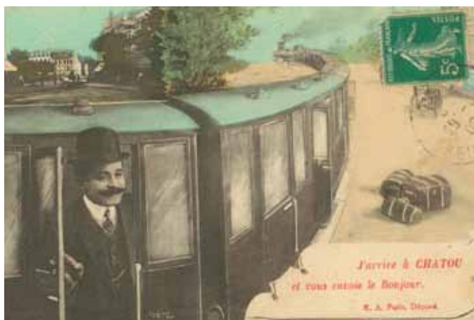
▲ Carte postale Cachet postal 1908 Chatou, musée Fournaise

En 1865, il reçoit quatre prix pour les épreuves du dessin copié, du dessin de plante vivante, de gravure sur bois et du dessin d'après la ronde-bosse composée.