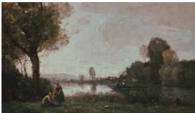
▲ J-B Corot La Seine à Chatou 1855 Berlin, Alte Nationalgalerie

Les Lavandières reprend un thème largement prisé dans la peinture au XIX e . L'atmosphère du tableau et la palette chromatique semblent s'inspirer de Jean-Baptiste Camille Corot (1796-1875). A partir des années 1850, Corot se détache du réalisme et s'intéresse au thème du « souvenir ». Ses paysages, comme sortis d'un rêve, sont lyriques et vaporeux. Peu d'éléments permettent de les situer.