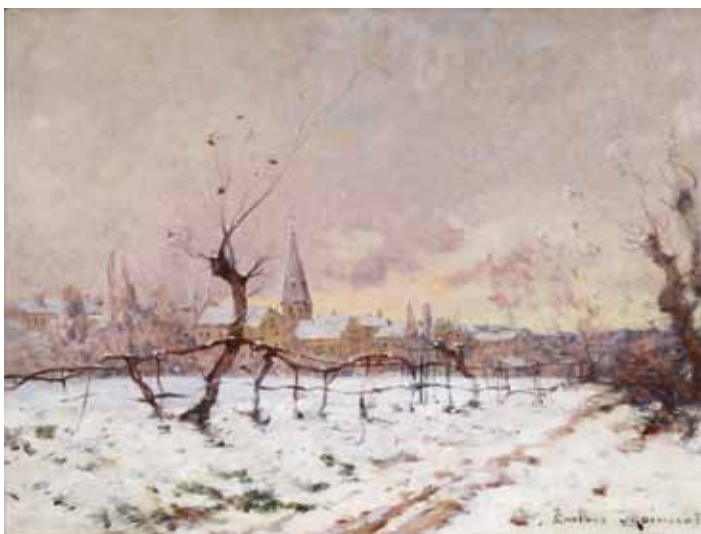
◀ Village et campagne sous la neige (Titre attribué ultérieurement) 4 ème quart du XIX e siècle Huile sur toile 46 ; 61 cm Collection particulière

Certains paysages n'ont pu être localisés, mais Gustave Maincent a probablement peint en province et dans le Sud de la France.