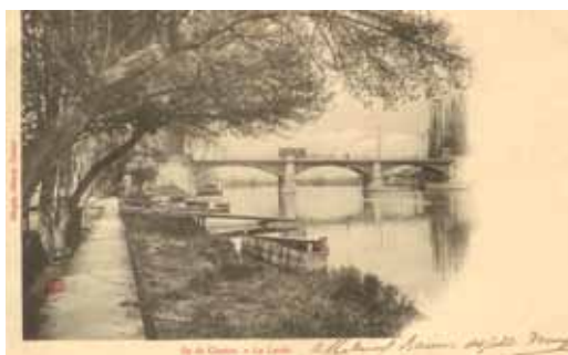
◀ Chatou - La Levée Carte postale Début XX e siècle Chatou, musée Fournaise