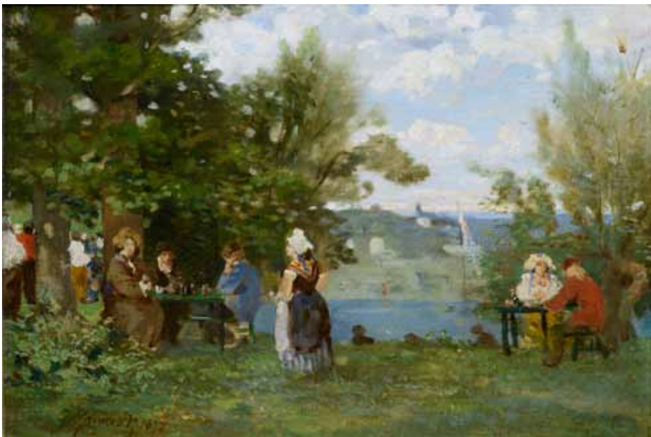
◀ Guinguette en bord de Seine (Titre attribué) 1872 32 ; 46 cm Croissy-sur-Seine, musée de la Grenouillère