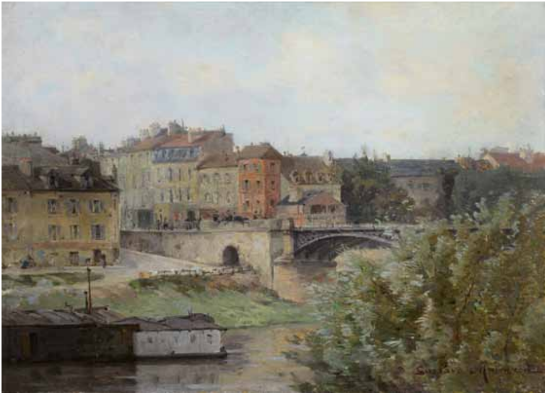
▲ Pont de Chatou (Titre attribué) Non daté Huile sur toile 33 ; 46 cm Collection particulière