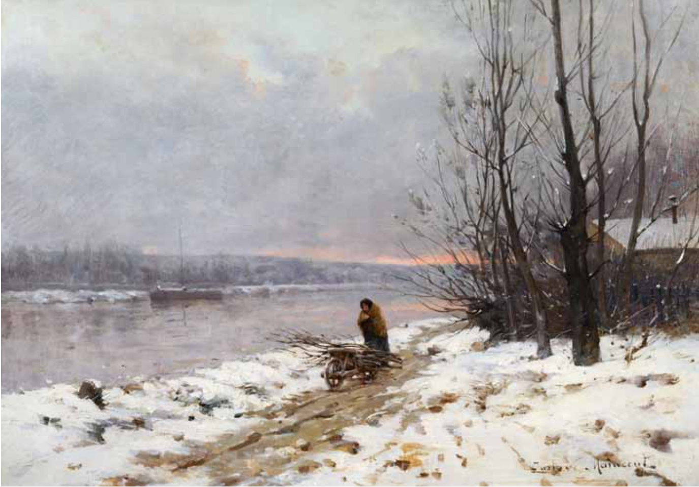
▲ La Corvée de bois en hiver (Titre attribué ultérieurement) 4 ème quart du XIX e siècle Huile sur toile 46 ; 33 cm Collection particulière