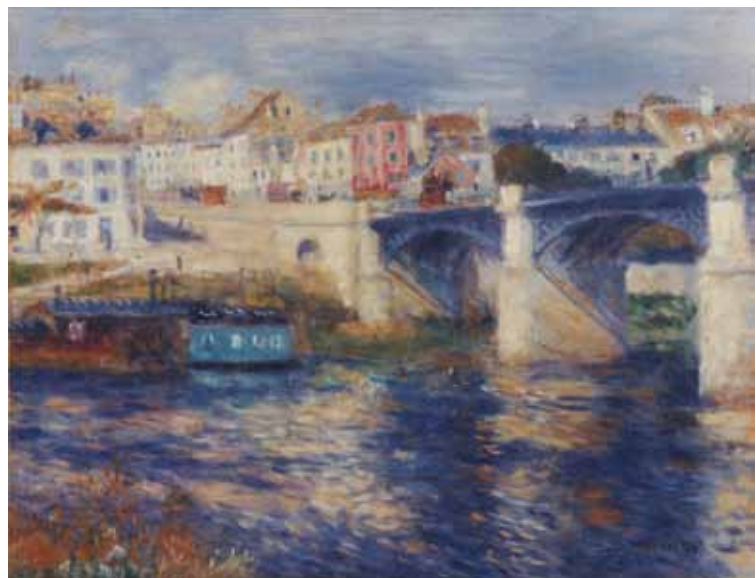
► Pierre Auguste Renoir (1841-1919) Le Pont de Chatou Vers 1875 Huile sur toile 51.1 ; 65.4 cm Chicago, Clark Art Institute