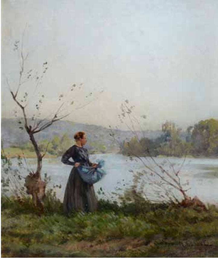
◀ La Cueillette au bord de l'eau (Titre attribué) Non daté Huile sur toile 70 ; 61 cm Collection particulière