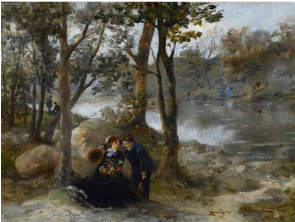
◀ Scène galante (Titre attribué) Non daté Huile sur toile 24.5 ; 55 cm Collection P.-F. Maincent