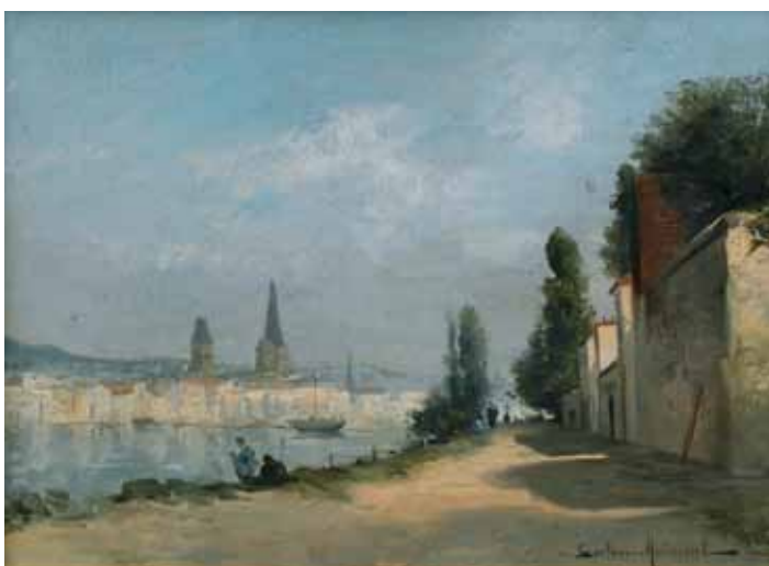
◀ Ville sous le soleil (Titre attribué ultérieurement) 4 ème quart du XIX e siècle Huile sur toile 46 ; 61 cm Collection P.-F. Maincent