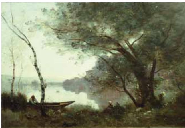
▲ J-B Corot Le Batelier de Mortefontaine vers 1865-1870 New York, The Frick Collection