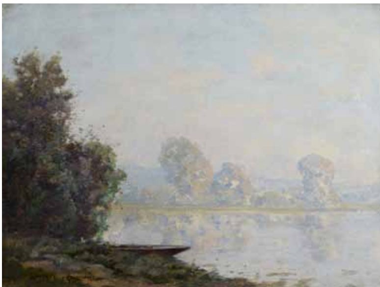
◀ Le Matin Non daté Huile sur toile 46 ; 61 cm Collection particulière