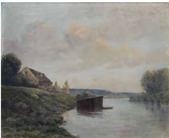
◀ Rivière en Vendée (Titre attribué ultérieurement) 4 ème quart du XIX e siècle Huile sur toile 46 ; 61 cm Collection P.-F. Maincent