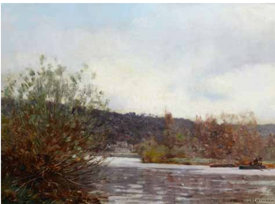
◀ Canotage entre les îles (Titre attribué) Non daté, Huile sur toile, 33 ; 46 cm Collection particulière