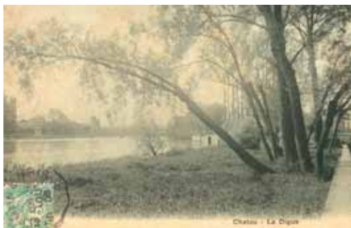
◀ Chatou - La Digue Carte postale Début XX e siècle Chatou, musée Fournaise

Maincent s'est placé derrière les arbres plantés le long de la digue pour peindre le pont routier en tournant le dos au pont ferroviaire que l'on aperçoit en arrière-plan de la carte postale ci-dessous.