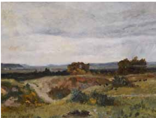
◀ Paysage campagnard (Titre attribué ultérieurement) 4 ème quart du XIX e siècle Huile sur toile 46 ; 61 cm Collection P.-F. Maincent